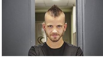
¿Sabes qué chefs son los más ricos del mundo? Cocínate el Mundo