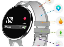
El Smart Watch que controla tu salud y está creando... colourwatch.net