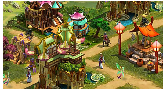
Jugadores de todo el mundo han esperado este juego! Elvenar