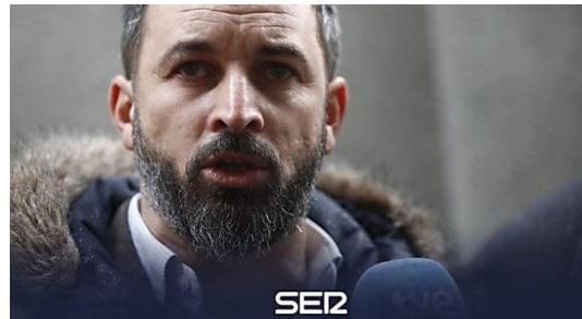
'Bofetada' a Vox desde Los Goya: "No escribimos eso, no nos da la p... gana" Cadena SER