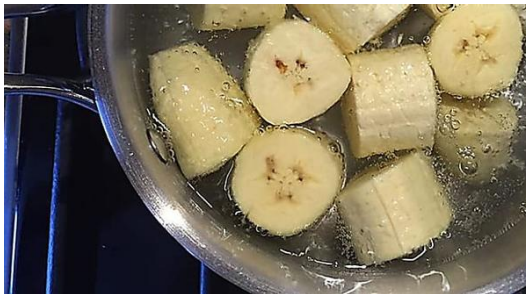
Quiroprácticos sorprendidos: esto alivia años de dolor en las articulaciones... healthreports24.com