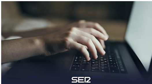
La Policía alerta sobre el timo de las facturas de la luz: "Nueva oleada de estafas" Cadena SER