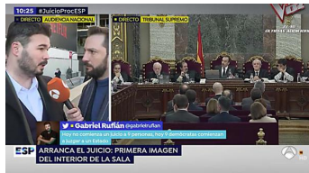
Gabriel Rufián vive un tenso momento antes de entrar... Lo más visto